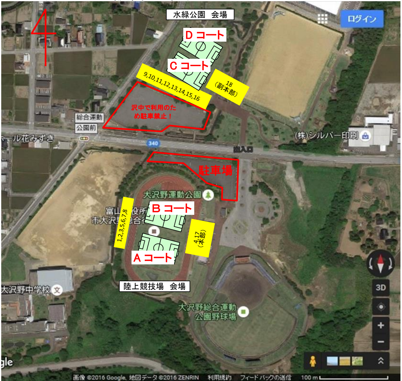
テント設置・利用表